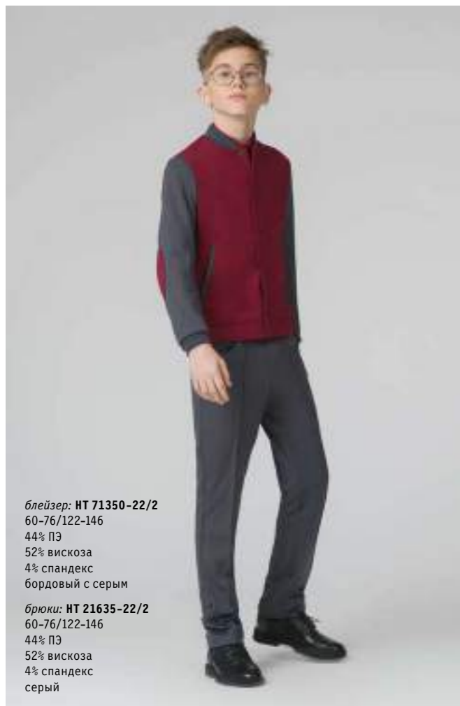
блейзер: НТ 71350-22/2 60-76/122-146 44% ПЭ 52% вискоза 4% спандекс бордовый с серым