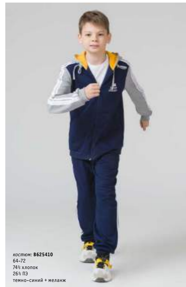
костюм: B625410 64-72 74% хлопок 26% ПЭ темно-синий + меланж