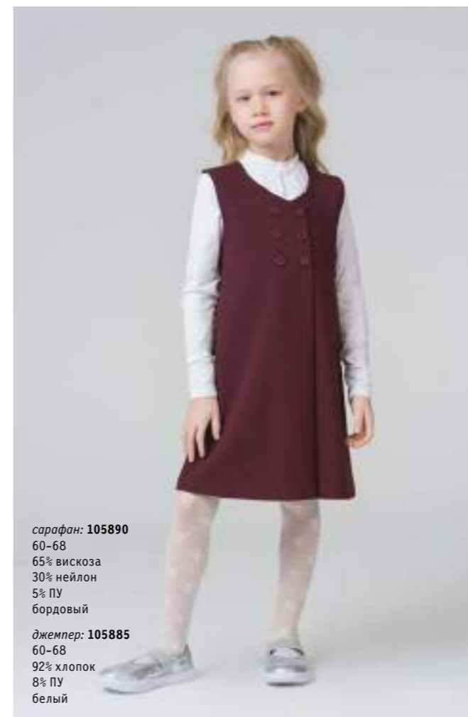
сарфан: 105890 60-68 65% вискоза 30% нейлон 5% ПУ бордовый