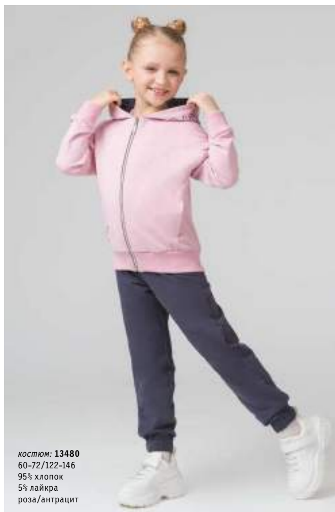
костюм: 13480 60-72/122-146 95% хлопок 5% лайкра роза/антрацит