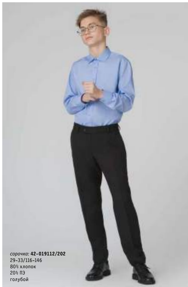
сорочка: 42-019112/202 29-33/116-146 80% хлопок 20% ПЭ голубой