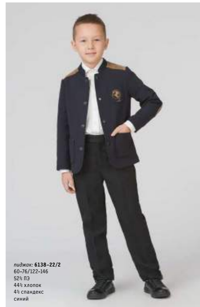
пиджак: 6138-22/2 60-76/122-146 52% ПЭ 44% хлопок 4% спандекс синий