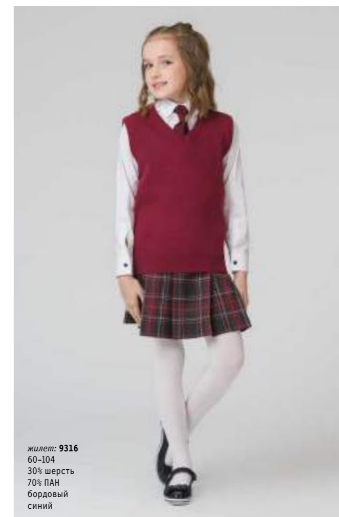
жилет: 9316 60-104 30% шерсть 70% ПАН бордовый синий