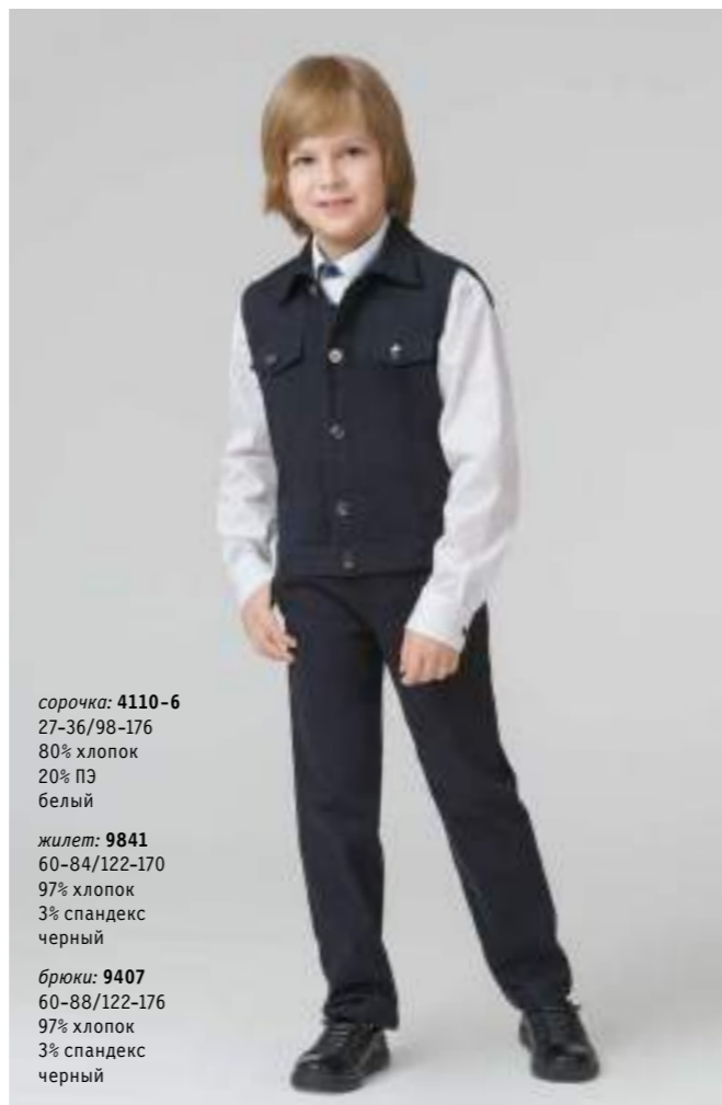
сорочка: 4110-6 27-36/98-176 80% хлопок 20% ПЭ белый жилет: 9841 60-84/122-170 97% хлопок 3% спандекс черный брюки: 9407 60-88/122-176 97% хлопок 3% спандекс черный