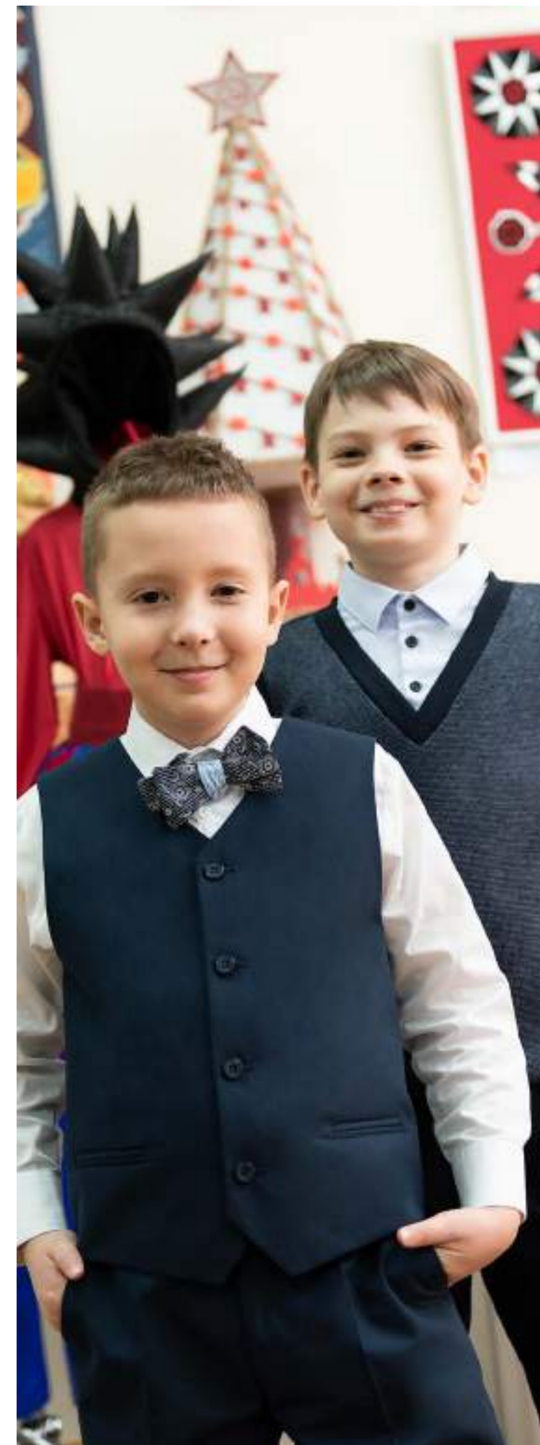
брюки: 20639-22/2 60-76/122-146 35% вискоза 63% ПЭ 2% лайкра синий