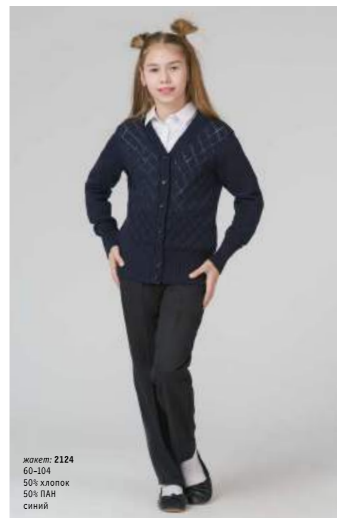
жакет: 2124 60-104 50% хлопок 50% ПАН синий