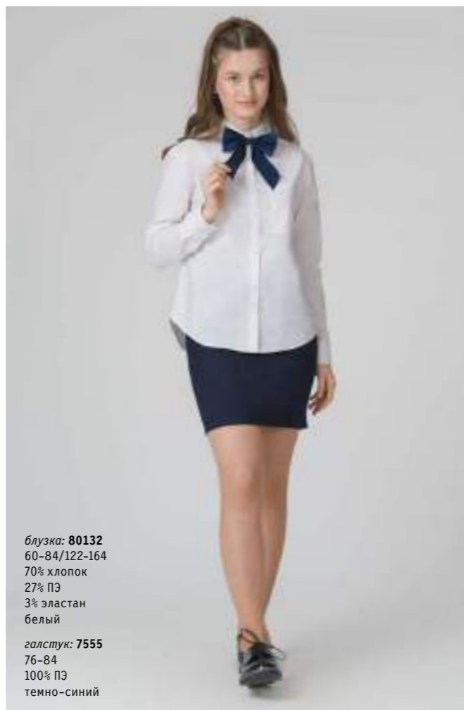
блузка: 80132 60-84/122-164 70% хлопок 27% ПЭ 3% эластан белый галстук: 7555 76-84 100% ПЭ темно-синий