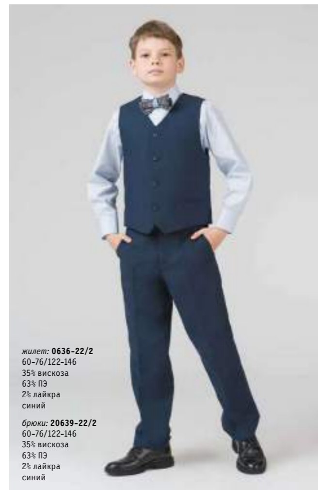
жилет: 0636-22/2 60-76/122-146 35% вискоза 63% ПЭ 2% лайкра синий