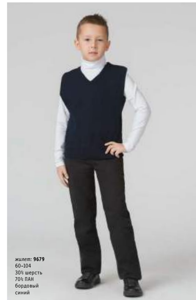
жилет: 9679 60-104 30% шерсть 70% ПАН бордовый синий