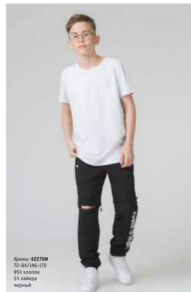
брюки: 42270И 72-84/146-170 95% хлопок 5% лайкра черный