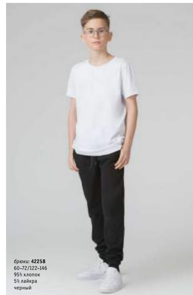
брюки: 42258 60-72/122-146 95% хлопок 5% лайкра черный