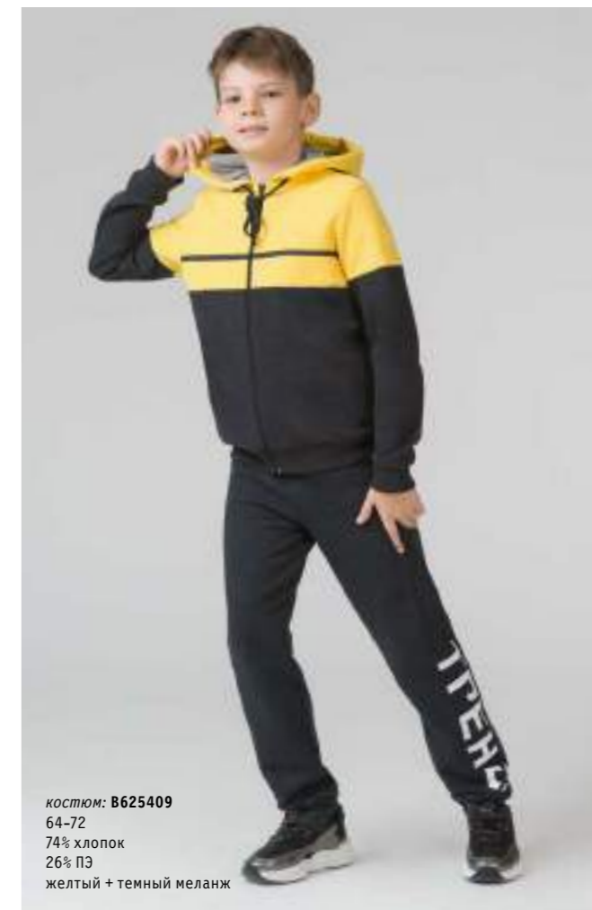
костюм: B625409 64-72 74% хлопок 26% ПЭ желтый + темный меланж