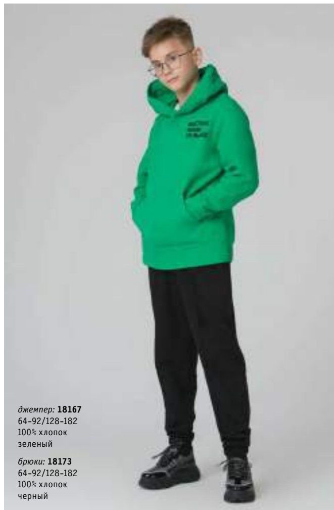
джерсер: 18167 64-92/128-182 100% хлопок зеленый