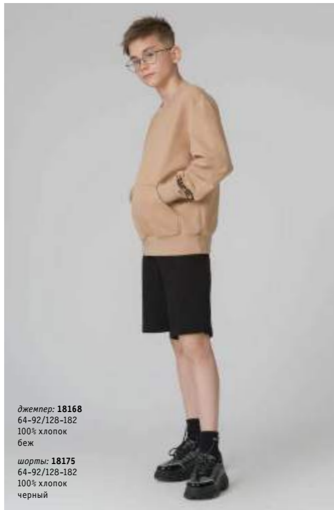
джерсер: 18168 64-92/128-182 100% хлопок беж