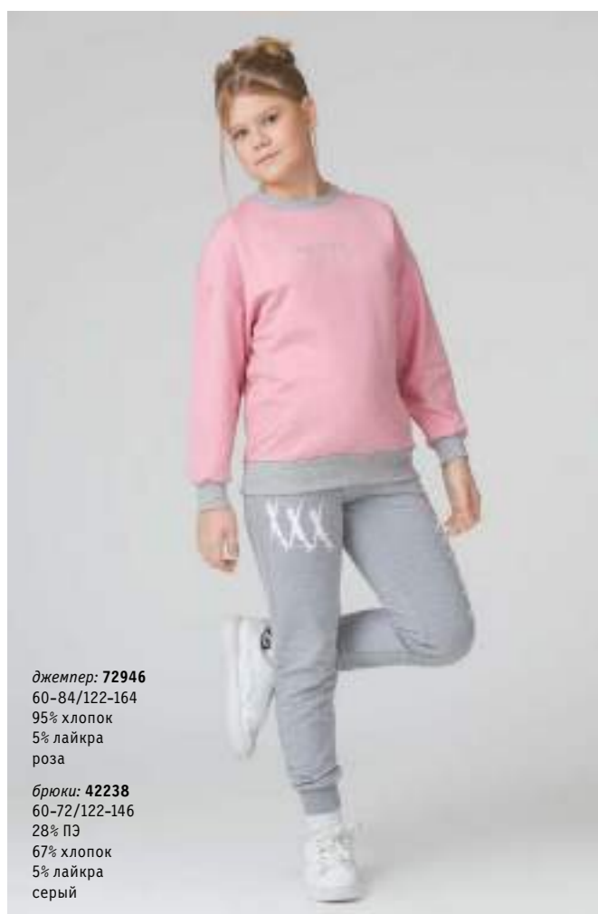
джерсер: 72946 60-84/122-164 95% хлопок 5% лайкра роза брюки: 42238 60-72/122-146 28% ПЭ 67% хлопок 5% лайкра серый