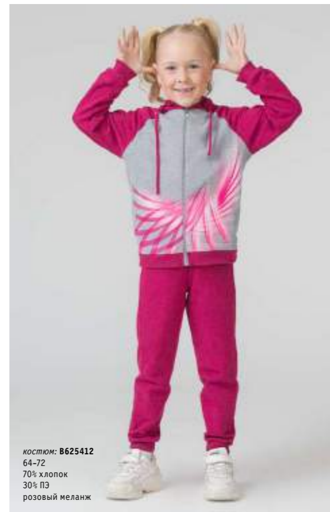
костюм: B625412 64-72 70% хлопок 30% ПЭ розовый меланж