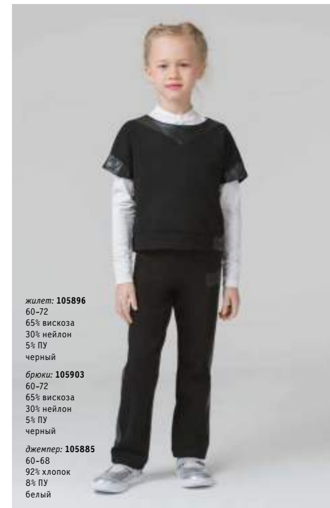
жилет: 105896 60-72 65% вискоза 30% нейлон 5% ПУ черный брюки: 105903 60-72 65% вискоза 30% нейлон 5% ПУ черный джемпер: 105885 60-68 92% хлопок 8% ПУ белый