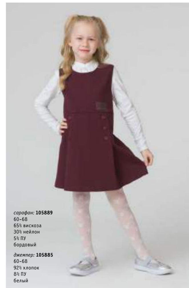
сарфан: 105889 60-68 65% вискоза 30% нейлон 5% ПУ бордовый