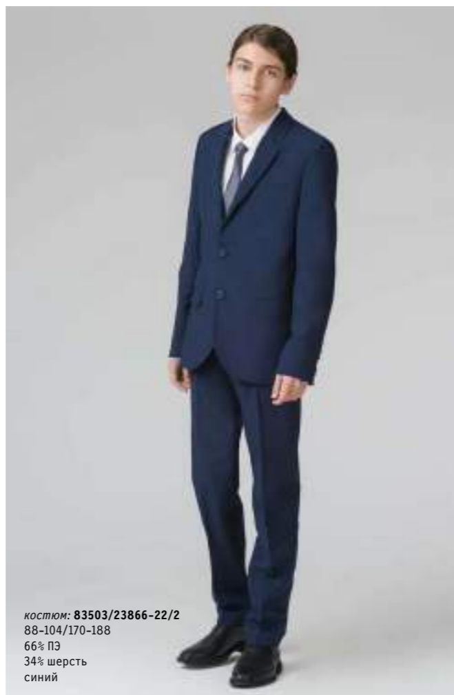
костюм: 83503/23866-22/2 88-104/170-188 66% ПЭ 34% шерсть синий