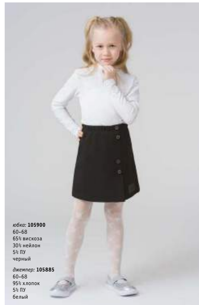
юбка: 105900 60-68 65% вискоза 30% нейлон 5% ПУ черный джерсер: 105885 60-68 95% хлопок 5% ПУ белый