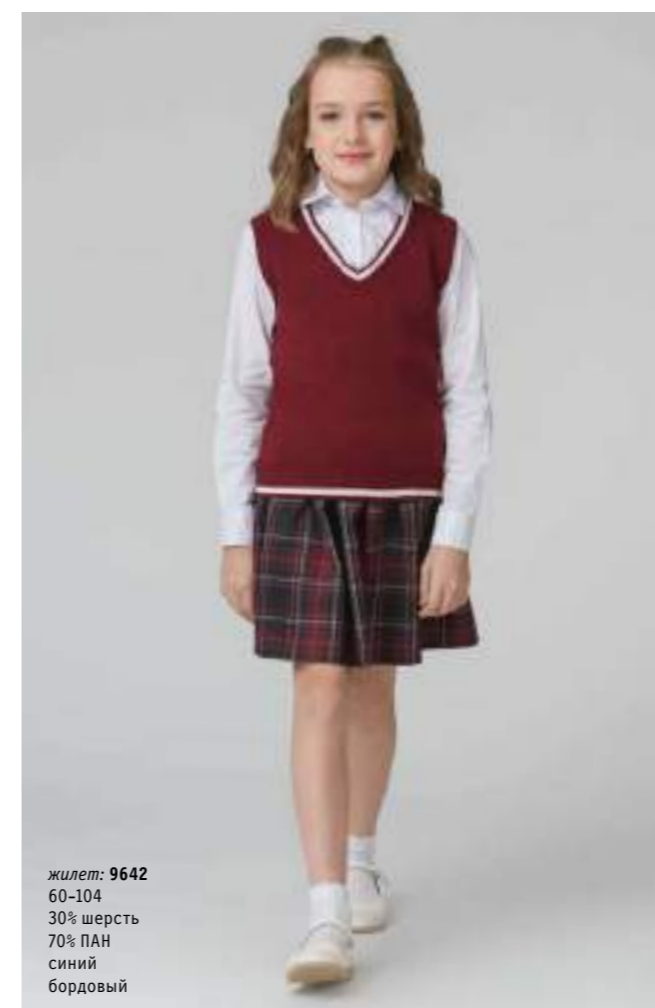
жилет: 9642 60-104 30% шерсть 70% ПАН синий бордовый