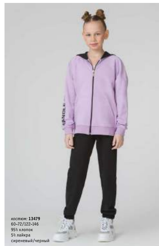
костюм: 13479 60-72/122-146 95% хлопок 5% лайкра сиреневый/черный