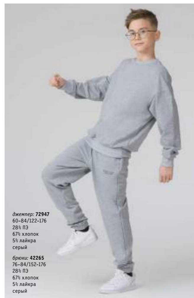
джерсер: 72947 60-84/122-176 28% ПЭ 67% хлопок 5% лайкра серый брюки: 42265 76-84/152-176 28% ПЭ 67% хлопок 5% лайкра серый