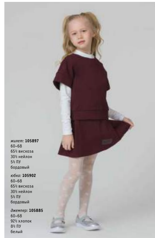
жилет: 105897 60-68 65% вискоза 30% нейлон 5% ПУ бордовый