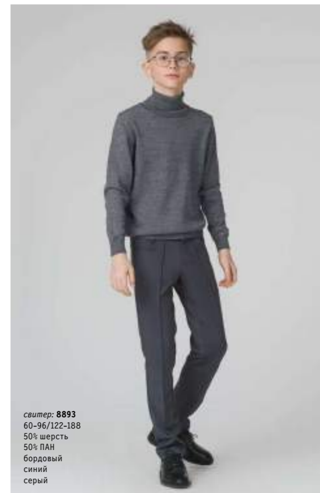
свитер: 8893 60-96/122-188 50% шерсть 50% ПАН бордовый синий серый