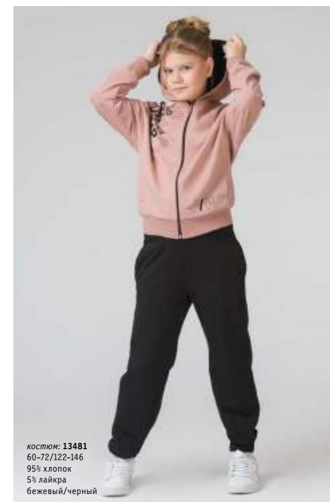
костюм: 13481 60-72/122-146 95% хлопок 5% лайкра бежевый/черный