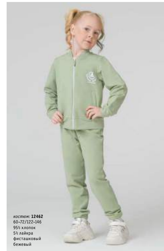
костюм: 12462 60-72/122-146 95% хлопок 5% лайкра фисташковый бежевый