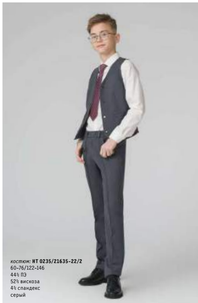
костюм: НТ 0235/21635-22/2 60-76/122-146 44% ПЭ 52% вискоза 4% спандекс серый