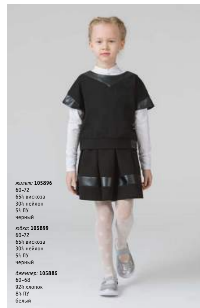
жилет: 105896 60-72 65% вискоза 30% нейлон 5% ПУ черный юбка: 105899 60-72 65% вискоза 30% нейлон 5% ПУ черный джемпер: 105885 60-68 92% хлопок 8% ПУ белый