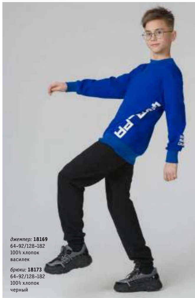
джерсер: 18169 64-92/128-182 100% хлопок василек