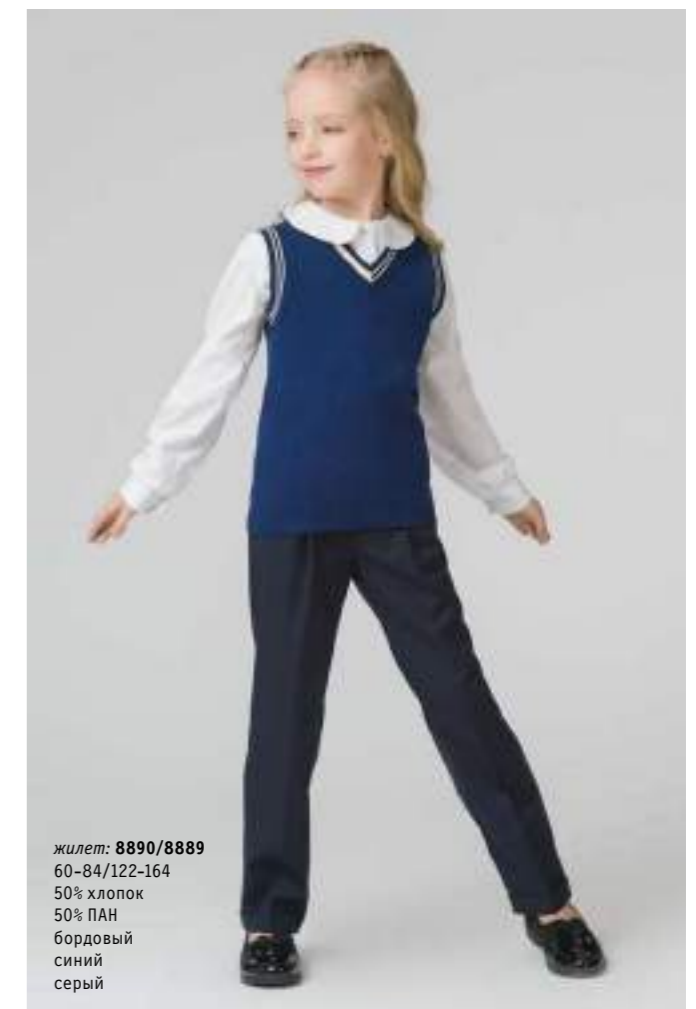
жилет: 8890/8889 60-84/122-164 50% хлопок 50% ПАН бордовый синий серый