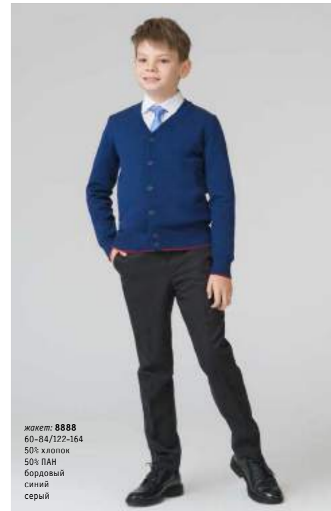
жакет: 8888 60-84/122-164 50% хлопок 50% ПАН бордовый синий серый