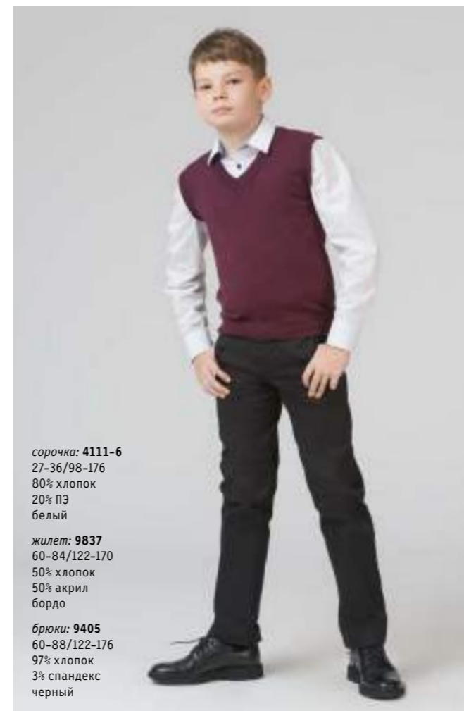
сорочка: 4111-6 27-36/98-176 80% хлопок 20% ПЭ белый жилет: 9837 60-84/122-170 50% хлопок 50% акрил бордо брюки: 9405 60-88/122-176 97% хлопок 3% спандекс черный