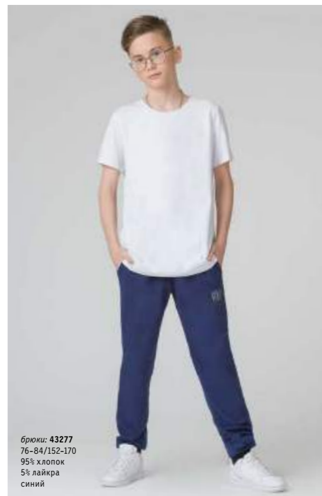
брюки: 43277 76-84/152-170 95% хлопок 5% лайкра синий