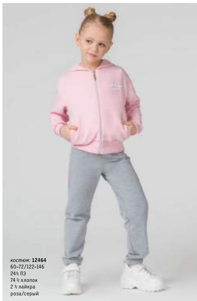
костюм: 12464 60-72/122-146 24% ПЭ 74% хлопок 2% лайкра роза/серый