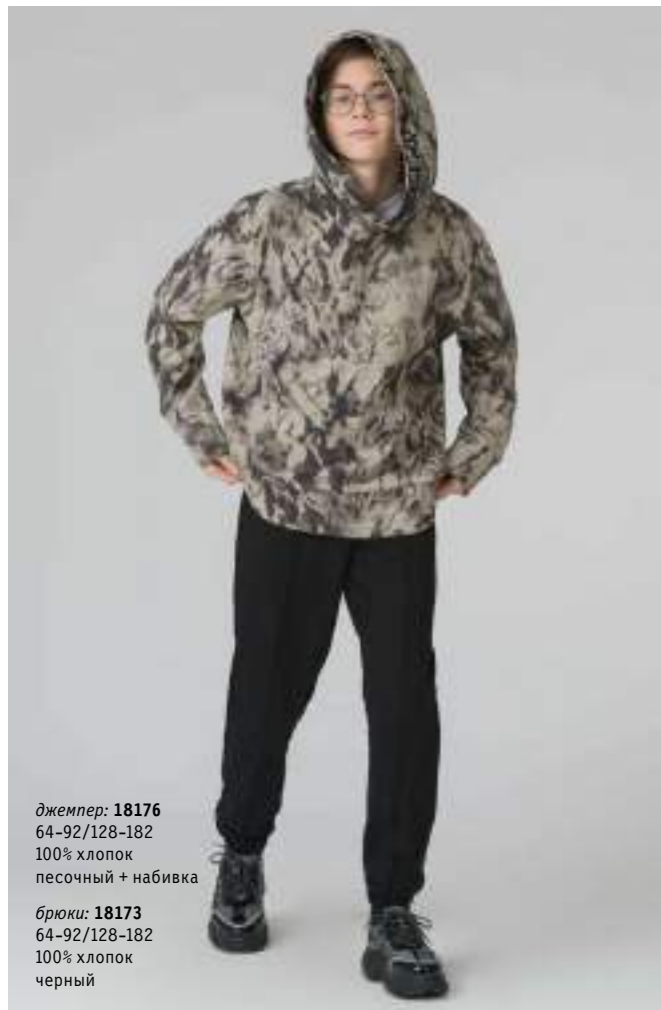
джерсер: 18176 64-92/128-182 100% хлопок песочный + набивка