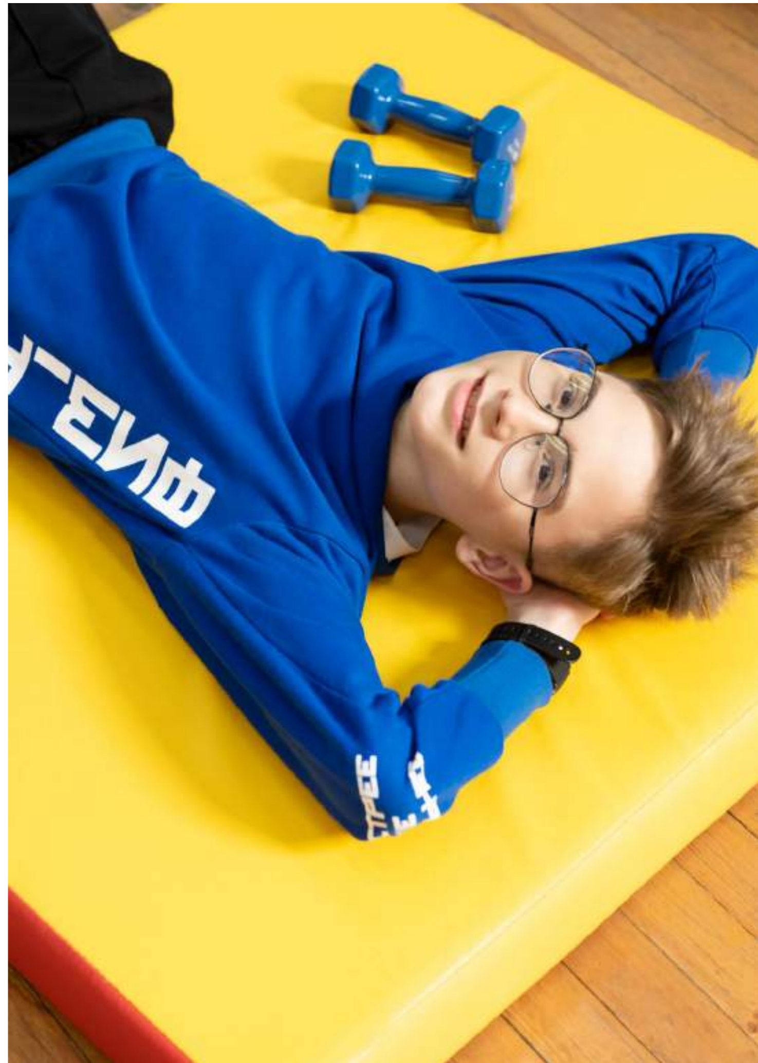
брюки: 18173 64-92/128-182 100% хлопок черный