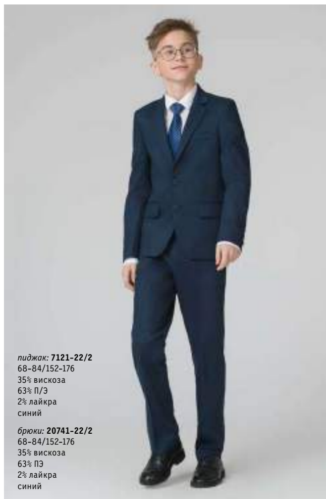
пиджак: 7121-22/2 68-84/152-176 35% вискоза 63% П/Э 2% лайкра синий