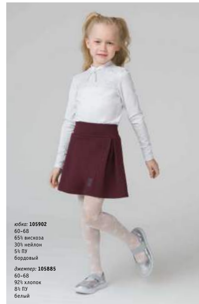
юбка: 105902 60-68 65% вискоза 30% нейлон 5% ПУ бордовый