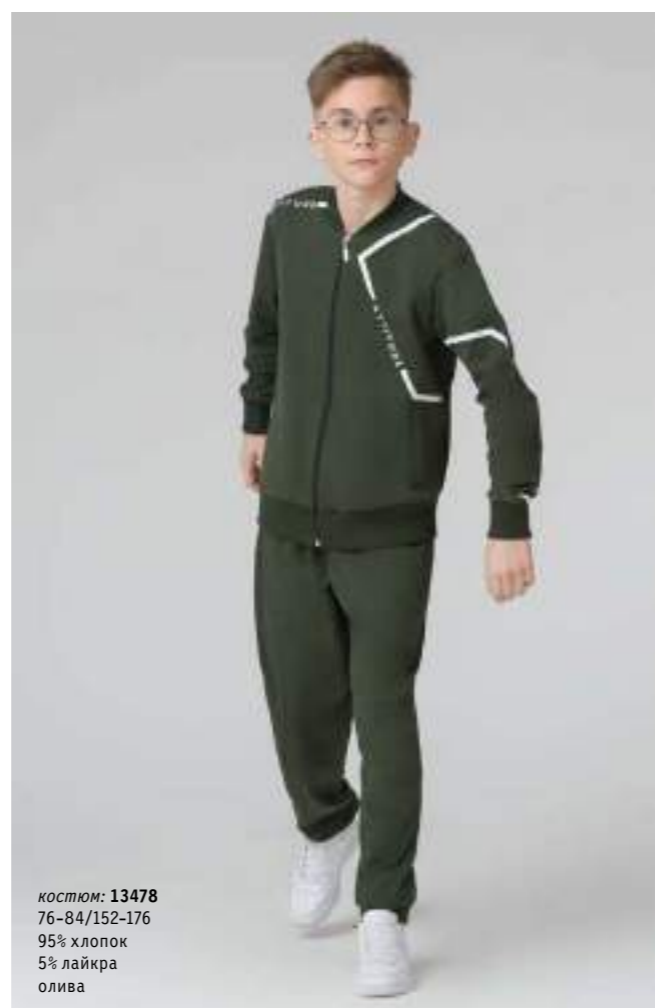
костюм: 13478 76-84/152-176 95% хлопок 5% лайкра олива

«ТОК» – энергия, импульс, движение, заряд.