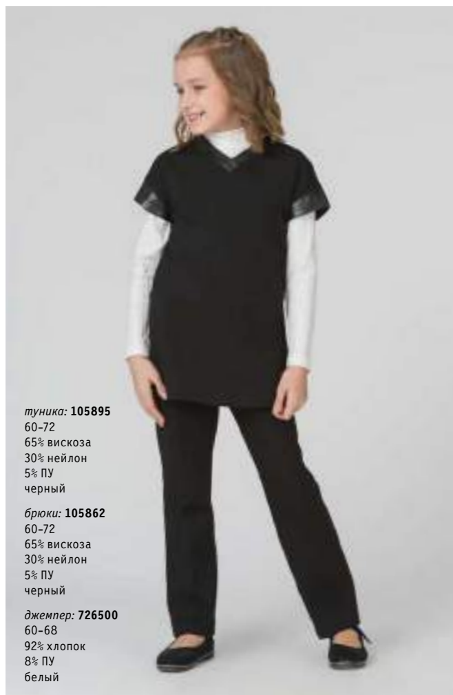
туника: 105895 60-72 65% вискоза 30% нейлон 5% ПУ черный