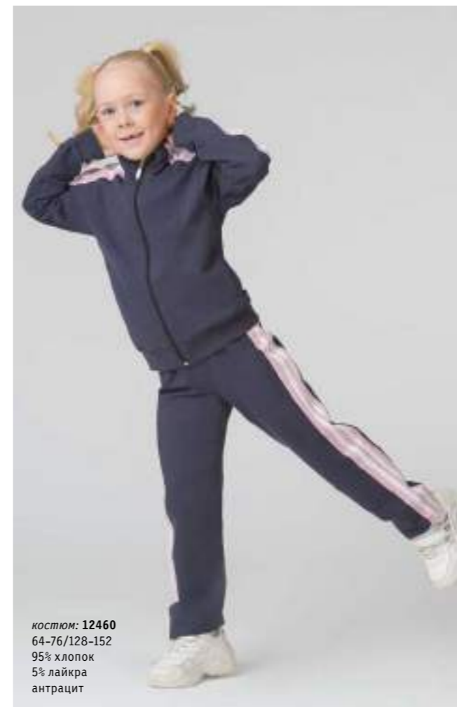
костюм: 12460 64-76/128-152 95% хлопок 5% лайкра антрацит