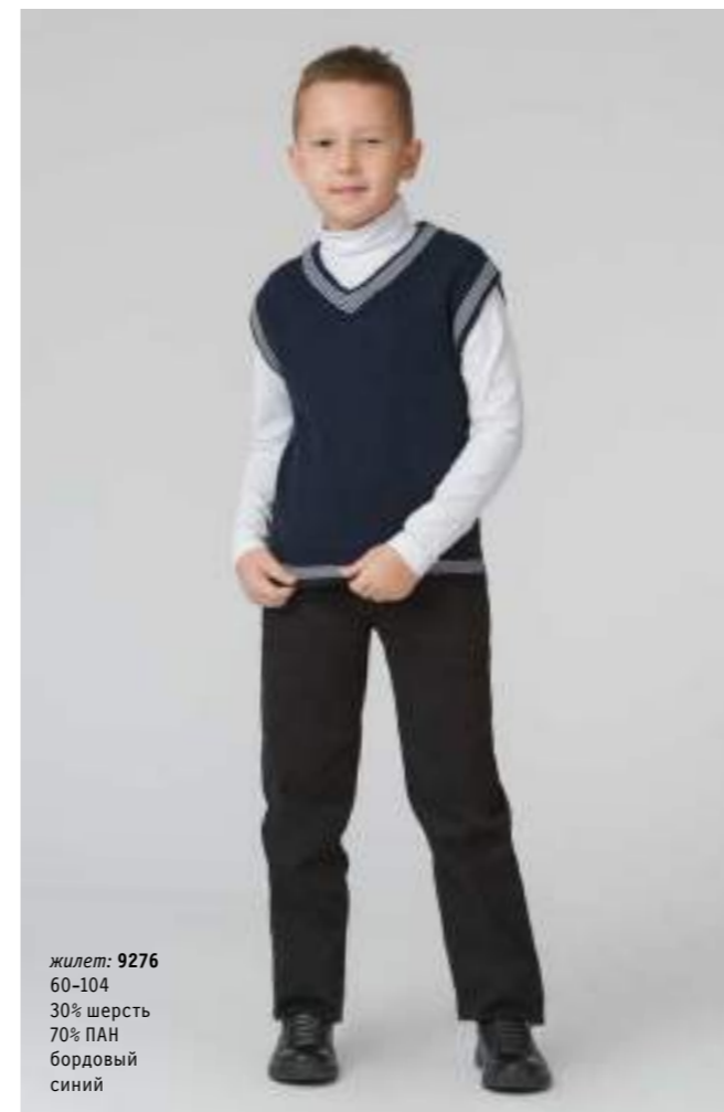
жилет: 9276 60-104 30% шерсть 70% ПАН бордовый синий