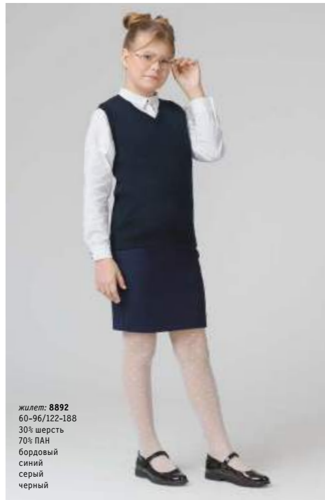
жилет: 8892 60-96/122-188 30% шерсть 70% ПАН бордовый синий серый черный

Качество продукции ОАО «Алеся» отвечает самым высоким Европейским критериям.