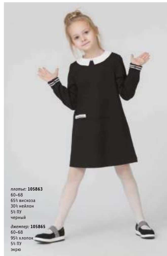
платье: 105863 60-68 65% вискоза 30% нейлон 5% ПУ черный джерсер: 105865 60-68 95% хлопок 5% ПУ экрю