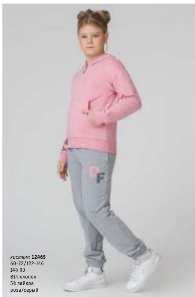
костюм: 12465 60-72/122-146 14% ПЭ 81% хлопок 5% лайкра роза/серый