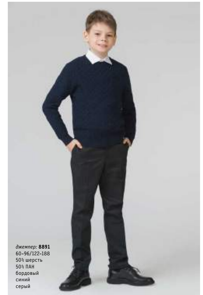
джерсер: 8891 60-96/122-188 50% шерсть 50% ПАН бордовый синий серый